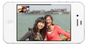
向性能较低的设备传输较小的数据，使视频更加流畅

菊风 RCS SDK 内置了先进的音视频引擎，采用了码流甜点控制、带宽节省模式及云端设备管控等业内领先的技术，带给您极致的高清视频通话体验。