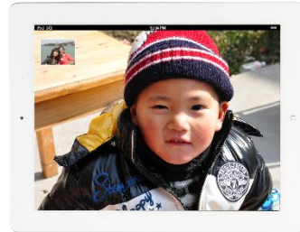
向性能较高的设备传输较大的高清数据，使视频更加清晰